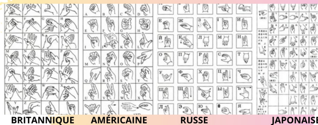
BRITANNIQUE AMÉRICAINE RUSSE JAPONAISE

Celle-ci diffère selon les langues des signes. La majorité des alphabets manuels se font à un main, exception faite des LS de la famille britannique. Cela permet à certaines occasions d'épeler un mot, un prénom ou encore un lieu dont on ne connaît pas le signe.