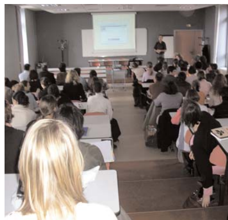
Réunion d'information sur le site de Rodez