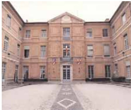
Cour de la Préfecture de Toulouse

Programme régional en ligne : http://www.haute-garonne.pref.gouv.fr