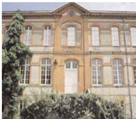
Site IUFM avenue de Muret

N'hésitez pas à venir nous rendre visite au 181, avenue de Muret à Toulouse ! et à faire connaître cet événement.