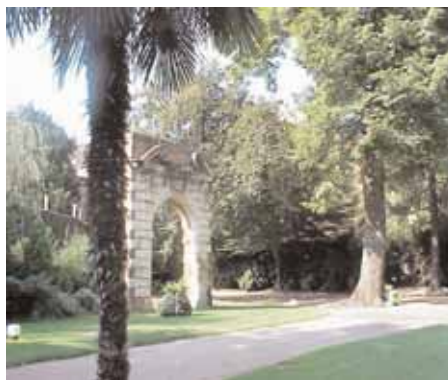
Jardin de la Préfecture de Toulouse