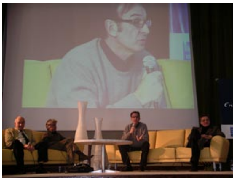
INTERVENANTS : Daniel COSTANTINI, entraîneur national de handball Robin RENUCCI, comédien-metteur en scène Michel VAUTROT, arbitre international de football

L'autorité est une composante essentielle du métier d'enseignant, mais les méthodes pour l'instaurer demeurent cependant introuvables dans les manuels. Et si nous sommes le plus souvent convaincus de son utilité, il est difficile de savoir comment elle s'acquiert, comment elle s'exerce et dans quelle quantité elle nous est nécessaire pour assurer le bon fonctionnement de la classe.