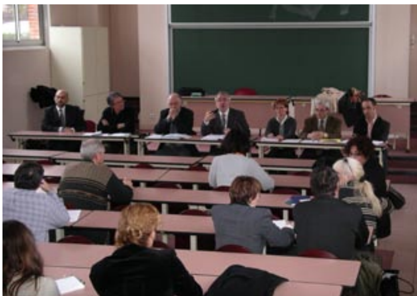
ASSEMBLÉE GÉNÉRALE DES PERSONNELS BIATOSS DU 30 JANVIER 2008