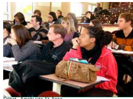
Débat - Amphi site St-Agne