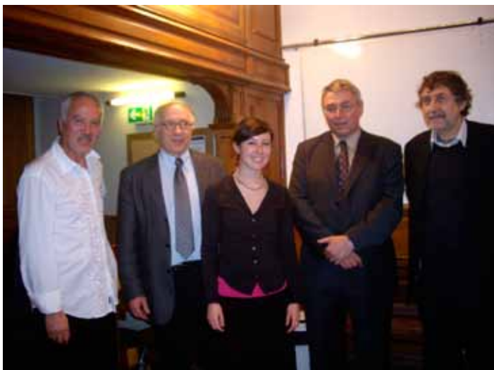
Remise du prix des écrits professionnels de la poésie à l'Institut Océanographique à Paris - décembre 2009